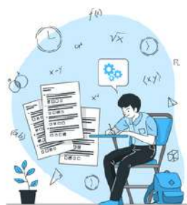
Bulletins trimestriels Examens blancs