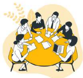
Conseils de classe