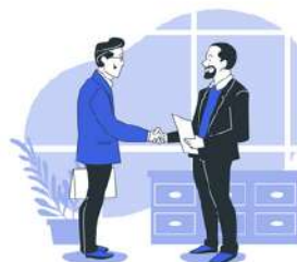
Contacts réguliers avec les familles et les élèves