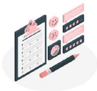
Bilan scolaire toutes les 6 semaines